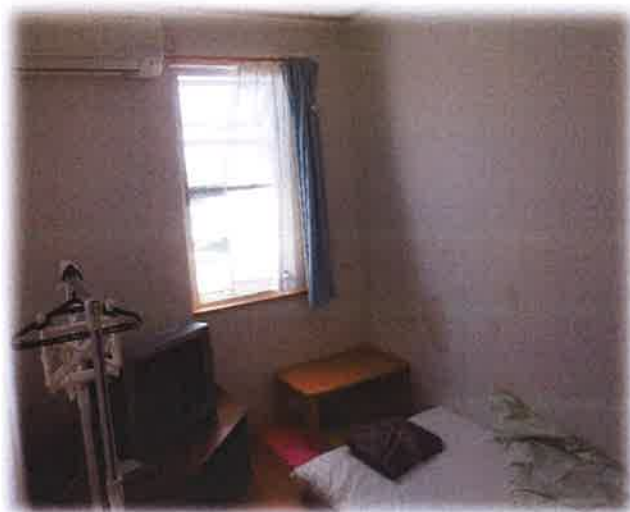
～こちらは床タイプの居室～

みなさん居室では、好きなTV番組を見たり、マンガを読んだりとお自宅での過ごし方同様、のんびりとされています。どんたくでは、変に緊張することなく“自分らしく、いつも通りの過ごし方”で利用していただければと考えております。